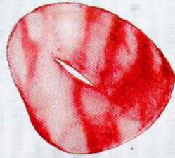
Petr Veselý, Božské srdce , 2009, akvarel, papír, 30 x 21 cm